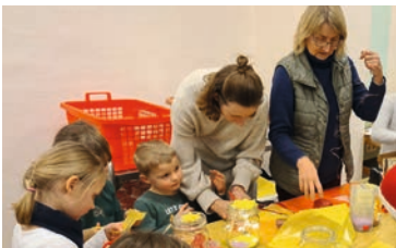
Text u. Foto: Ch. Weidemann

Weitere Infos finden sich auch unter: www.melle-petri.de/Kunterbunte Familienkirche und Instagram: stpetris.familienkirche .