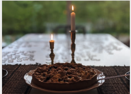
Zur blauen Stunde im Herbst

Am Sonntag, 03.11.2024 , wollen wir gerne die Silberne Konfirmation feiern mit allen, die 1998 oder 1999 in Oldendorf konfirmiert wurden . Um 10.30 Uhr laden wir zu einem feierlichen Gottesdienst mit Abendmahl ein. Im Anschluss daran soll es ein Zusammensein im Hallmannschen Haus geben. Wegen des großen zeitlichen Aufwandes, den unsere Pfarrsekretärin in den letzten Jahren betrieben hat, wollen wir in diesem Jahr darauf verzichten, die einzelnen Adressen herauszusuchen und bitten herzlich darum, diesen Termin in den entsprechenden Jahrgängen weiterzugeben und bekannt zu machen. Wer dabei sein möchte, möge sich bitte bis zum 29.10. im Pfarrbüro unter Angabe des Namens und der Adresse im Familienzentrum in Melle unter Tel: 05422-7092509 oder per Mail unter kg.oldendorf@evlka.de melden. Die Angemeldeten bekommen dann schriftlich weitere Informationen zum Ablauf der Silbernen Konfirmation. Wir hoffen auf Unterstützung, rege Beteiligung und freuen uns auf eine schöne Feier. Pastor Ralf Halbrügge