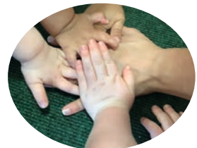
Text u. Foto: Kita

Wir freuen uns auf eine schöne Zeit, gemeinsam mit den Krippenkindern.